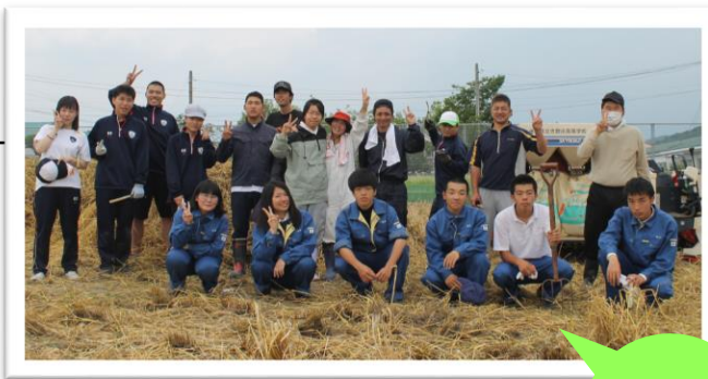
もち麦 プロジェクト