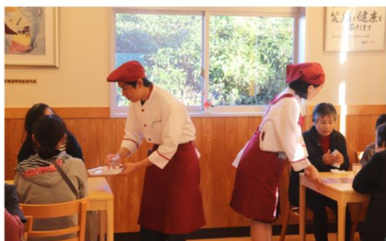
スクールカフェ吉野川 再開に向けて準備中です！